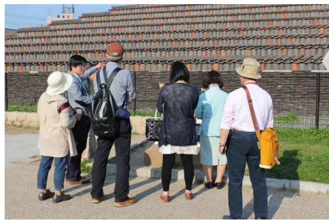
2015年度開講「大阪の歴史演習」授業風景