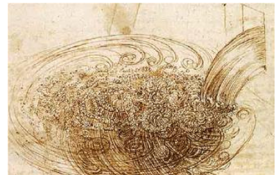
図 1 ダ・ヴィンチが描いた乱流のスケッチ

台風による暴風や増水した河川の流れなど、私たちの身の回りにはさまざまな流れがあります。流れのほとんどは乱れた流れ「乱流」です。約 500 年前、レオナルド・ダ・ヴィンチは乱流のスケッチを描き(図 1)、乱流は単に乱れた流れではなく、 大スケールの流れが発達することで小スケールの流れが生まれる ことが重要だと指摘しました。それ以降、乱流を理解するために、数学・物理分野などの基礎研究から、工学分野などの応用研究まで、さまざまな分野で膨大な研究が行われてきましたが、まだ十分な解明に至っていません。ロシアの数学者 Kolmogorov は 1941 年に、 乱流現象を理解するために重要な鍵となっているのが、異なるスケール間における運動エネルギーの輸送 であると指摘し、近代における乱流研究の骨子となっています。しかしながら、 運動エネルギー輸送の直接観測は非常に難しく、長年の未解決問題 となっていました。そこで、坪田教授らの研究グループは、極低温のルビジウム ※3 の原子気体の乱流に照射するレーザー光を巧みに制御することで、 大きな構造から小さな構造へ流れる運動エネルギー輸送の直接観測に世界で初めて成功 しました。